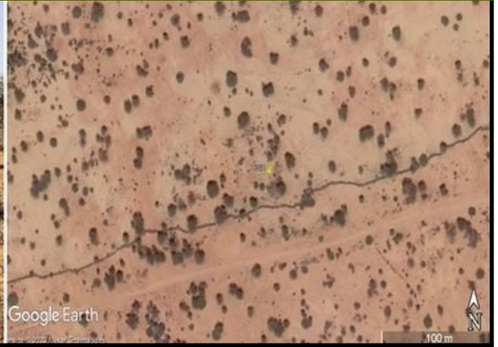
Sawir dhulka ah (bidix) iyo sawir cirka ah (midig), dhulka Galoolka iyo Xagarka ee Hawdka, Koonfurta Soomaalilaan.

Helitaanka biyuhu waxay saameeyaan korriinka geedka, laakiin waxa adag sida loo qeexo heerka, muddada iyo saamaynta xilli-roobaadyada kala duwan ee goobaha oomanaha ah, gaar ahaan marka aan la hayn agab macluumaadkaas lagu kaydiyo. Sannadkan horraantiisii, waxan booqday badhtamaha Soomaalilaan si aan u ogaanno meelaha macquulka ah ee lagu rakibi karo qalab tiijaabo ahaan loogu ogaan karo macluumaad arrimahaa la xidhiidha. Waxa la isku dari doonaa xogta kala duwan ee qalabkaasi kaydiyo ee la xidhiidha qoyaanka carrada, heerkulka carrada, heerkulka hawada iyo korriinka geedka oo lagu daray xogaha geedaha ee laga soo qaaday dayax-gacmeedka Copernicus Sentinel-2, halkaas oo laga qiyaasi karo saamaynta heerka biyhu ku leeyihiin korriinka geedka sannadkii oo dhan.