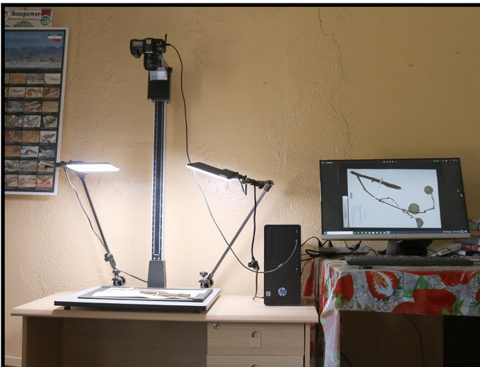
Agabka sawiridda muunadaha dhiroonka.

Diyaargarawga dhanka tababarka la xidhiidha cayayaanka (Hoosta Eeg) waxa aanu soo kordhinnay qalabkii loo baahnaa si tababarkaasi u qabsomo.