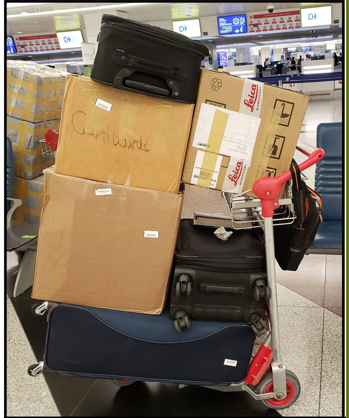
U socdaalaya Hargeysa