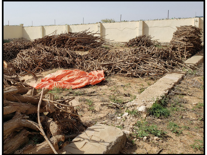
Goobta lagu kala sooco Garanwaaga foornada ka hor

daalladaas wax saamayn oo muuqda illaa haatan ma leh. Galoolka ayaa weli dhuxusha laga shidaa garanwaaguna weli wuu fidayaa.