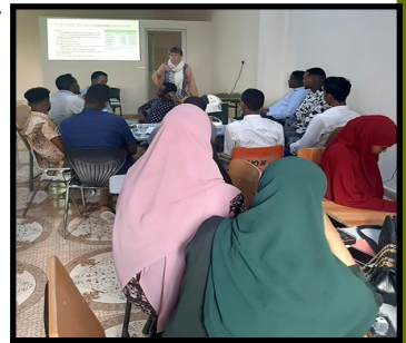
Fasalka kaddib markii ay soo xaadireen 35 arday (laba ka mid ah saddexdii kooxood ayaa muuqda).

Haddii dibadda dalka laga dalban lahaa qiimaha raritaanka ayaa badanaya waxana la sugayaa waqti dheer. In gudaha dalka laga dalbado ayaa fiican taas oo hoos u dhigaysa qiimaha uu ku kacayo isla markaana dhaqaalaha dalka u fiican.