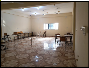
Fasalka abla'ablaynta dhirta, 15 daqiiqo ka hor intii aan casharku bilaabmin.

Fasallada sayniska waxa looga baahan yahay in ay ardayga siiyaan tijaabooyin mawduuca la xidhiidha iyo diyaarinta warbixinno saynis ah. Waxa la isku dhex dhafi karaa xiisado 'shaybaadhka' ah iyo kuwa kale ee casharrada fasalka ah iyada oo manhajka la raacayo.